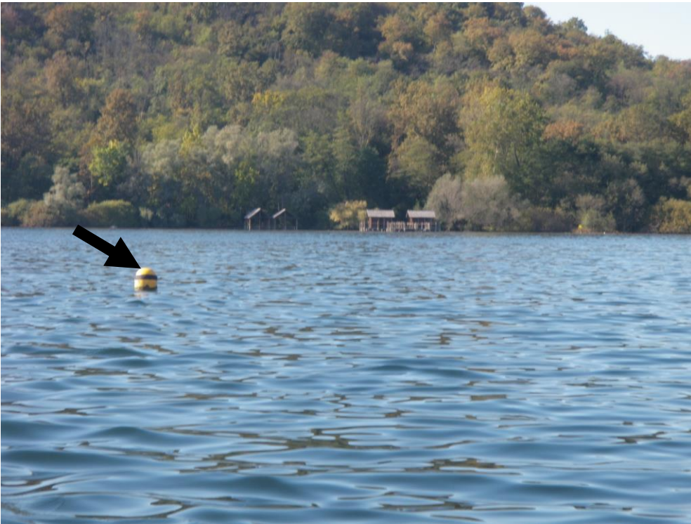
Boa AVNO - (boa più esterna del corridoio di uscita dell'AVNO)